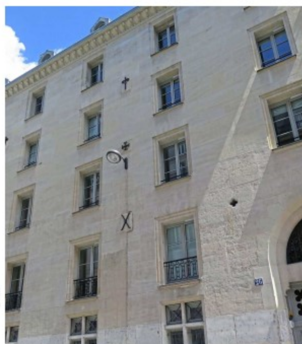
Paris (VIII e ), hier. C'est dans cet immeuble de la rue de Saint-Petersbourg que la Ville a réalisé des logements sociaux.

Rue de Miromesnil, c'est un bel Haussmannien de douze